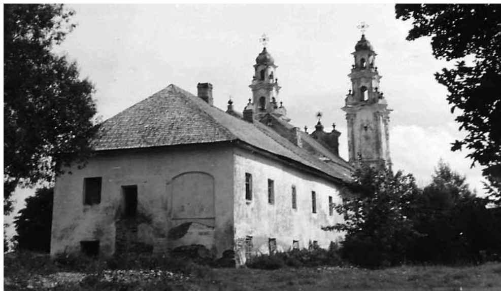
3. att. Skats uz daļēji apdzīvoto kādreizējo klostera ēku no ZA puses 1949. g. VKPAI PDC Inv. Nr. 3682. J. Vasiļeva foto

Abu stāvu gaitenā grīdas bija ieklātas ar sarkanām dedzināta māla flīzēm, kas 19. gs. vizitācijā dēvētas par ķieģeļu parketu. Dzīvojamās istabās bija dēļu grīdas. Vienā no telpām konstatēts 19. gs. izplatīts paņēmiens, uz dēļiem ar krāsojumu imitējot greznāku segumu, piem., parketu. Diemžēl no dekoratīvā krāsojuma uz dažiem dēļiem saglabājusies tikai melni krāsota astoņu staru zvaigzne.