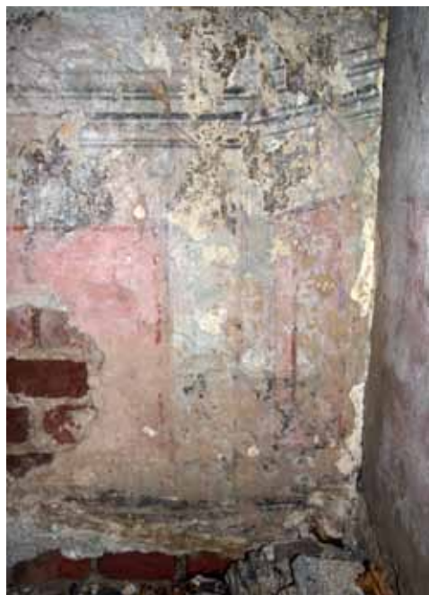
6. att. 18. gs. beigu dekoratīva t.s. trompe l'oeil gleznojums, imitējot sienas nišu. 2011