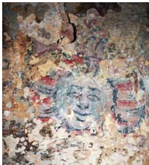
8. att. 18. gs. beigu dekoratīva gleznojuma fragments: Saule. 2011