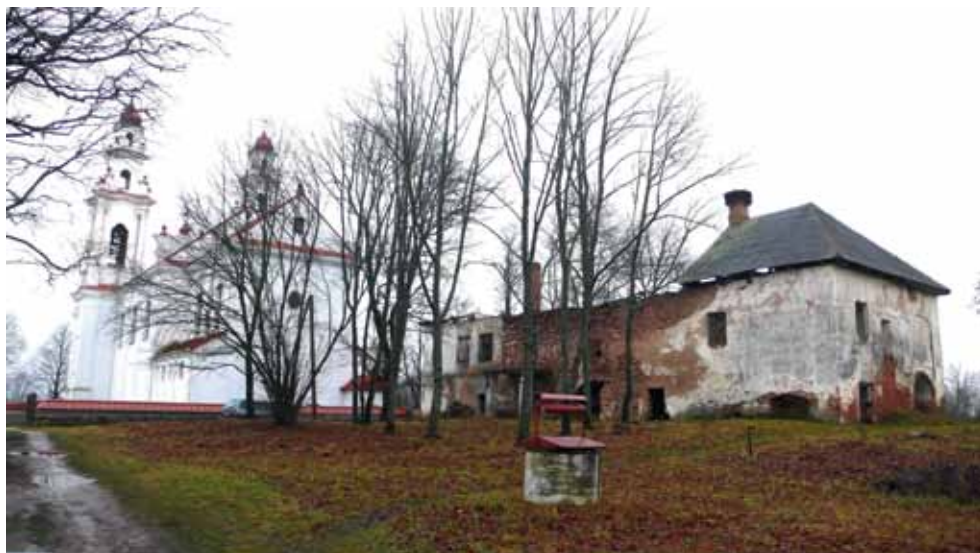
1. att. Pasienes baznīca un klostera ēka 2010. g. rudenī.

Šī raksta nosaukumā ietvertie vārdi „pēdējie pētījumi” ir skarbu faktu konstatācija, atstājot nelielu daļu ticībai un cerībai par Pasienes klostera ēkas tālākas pastāvēšanas iespējām. 2012. g. pagaidām vien atlikta klostera palikušās virszemes daļas nojaukšana. Jebkura iznākuma gadījumā plašāka informācija ir nepieciešama, lai koriģētu vai papildinātu joprojām nepilnīgos priekšstatus par Latvijas garīgo un materiālo kultūras mantojumu.