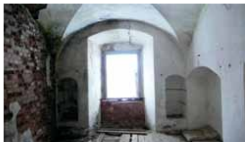
4. att. Kloštera otrā stāva celles sienas ar nišām. 2011.