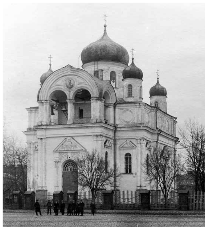
2.–4. att. Daugavpils Sv. Aleksandra Ņevska pareizticīgo katedrāles projektu kopijas. Katedrāle 20. gs. pirmajā pusē.