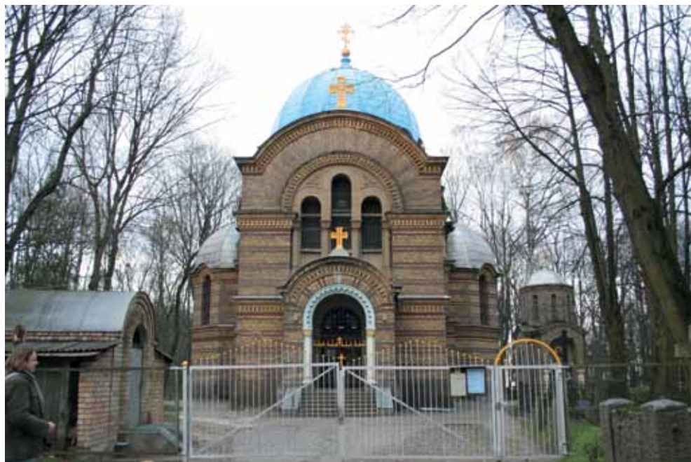
8. att. Rīgas Vissvētās Dievmātes patvēruma pareizticīgo baznīca. 2008