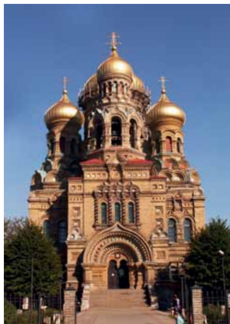
10. att. Liepājas Sv. Nikolaja Jūras pareizticīgo katedrāle. 2005