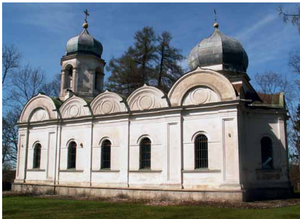
6. att. Galgauskas pareizticīgo baznīca. (Valsts kultūras pieminekļu aizsardzības inspekcijas Pieminekļu dokumentācijas centrs.) 1928