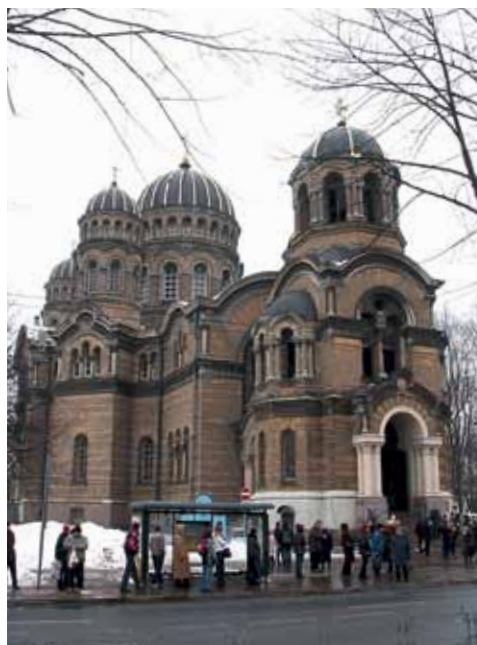
7. att. Rīgas Kristus piedzimšanas pareizticīgo katedrāle. 2005