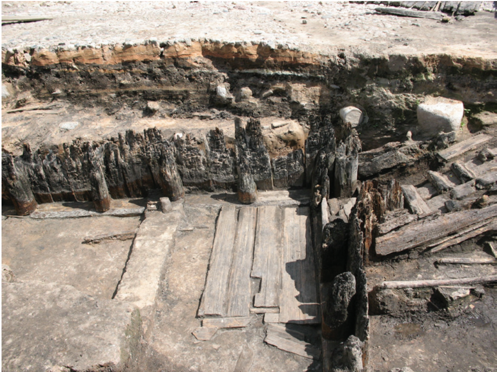
6. att. Cēsis. Zemē iedziļinātas koka statņu ēkas sienu fragments (atsegts Z. Apalas vadītajos izrakumos 2007. g.)

kotnēji tornis šai vietā nav bijis, un Raunas vārti bijuši ierīkoti tieši 1,7 m biežajā nocietinājuma sienā. Vārtu priekšā sienas ārpusē tornis piebūvēts vēlāk. Par to liecināja saduršuve starp torņa sānsienu un aizsargmūri. Tornim bijusi neregulāra četrstūra forma ar plāna izmēriem 8,8×10,8×7,2×9,8 metri. Tā sienu biežums arī bijis atšķirīgs — 1,6–2,0 metri. Vārtu aillas platums ap trīs metri. Gan torņa, gan aizsargsienas celtniecībā izmantots vienāds materiāls — dolomītakmeņi. Vienīgi torņa ziemeļaustrumu stūris vēlāk labots, daļu sienas pārmūrējot ar lielākiem laukakmeņiem. Domājams, šī paša remonta laikā torņa ziemeļu un austrumu sienām pamati pastiprināti, piemūrējot to ārpusē ap vienu m biezu laukakmeņu mūri. Torņa ārpusē vārtu aillai abās pusēs pieslēdzas no dolomītakmeņiem mūrētas 1,15 m un 1,35 m