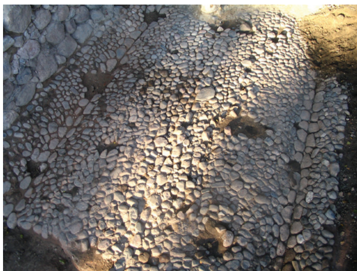
4. att. Valmieras viduslaiku pilsētas bruģētā iela blakus ziemeļu puses aizsargmūrim (atsegta T. Bergas vadītajos izrakumos 2006. g.)

Liecības par viduslaiku pilsētas dzīvojamību un ielām. Nozīmīgas liecības par Valmieras viduslaiku pilsētas apbūvi snieguši izrakumi 2006.–2007. 14 un 2008. g. 15 , kad pētītas lielākas platības un izdevies atsegt vairāku celtnu pamatus un pagrabus visā to plānojumā. Izrakumi notikuši tagadējā lielveikala pagalmā, kā arī Lāčplēša ielā 1, 1a, 2a un Rīgas ielā 2a. Pētījumu rajons aptver viduslaiku pilsētas ziemeļu pusi. Kultūras slāņa biezums ap diviem m, to veido pārsvarā smilšaini būvgruži ar atsevišķiem tumšākas zemes ieslēgumiem. Šādā irdenā zemes slānī nav labvēlīgi apstākļi, lai saglabātos koka celtnu paliekas. Tāpēc celtniecības liecības iegūtas tikai par septiņām 14.–17. gs. mūra ēkām. Senākās un interesantākās ir pilnā plānojumā atsegtais trīs celtnes tagadējā lielveikala pagalmā. Pirmā celtnē 12×9 m liela, tās vienu m biežās sienas mūrētas no laukakmeņiem, kas saistīti ar kaļķu javu. Sienām saglabājusies pamatu akmeņu pirmā kārtā 0,3 m augstumā. Celtnes pildījumā daudz