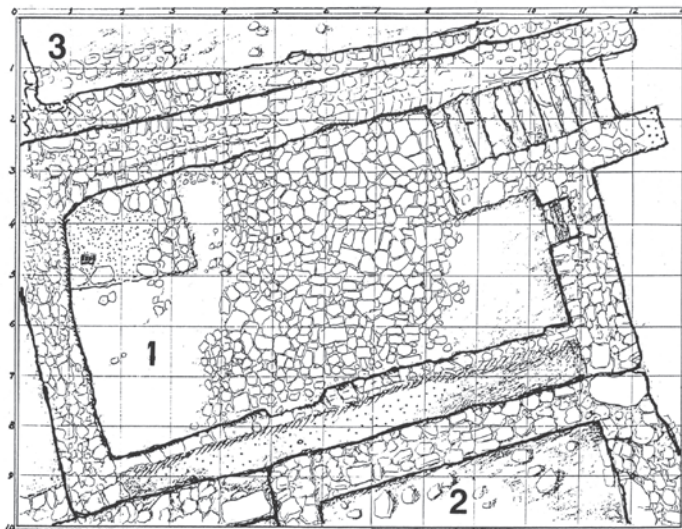
2. att. 1961. g. izrakumos Kokneses pilsētā atsegtas mūra ēkas plāni (A. Stubava vadītie izrakumi): 1 — pirmā pilnā plānojumā atsegtā ēka; 2 — otrā daļēji atsegtā ēka; 3 — trešā daļēji atsegtā ēka

rezultātiem. Aplūkosim katru šo pilsētiņu tādā secībā, kad tur uzsākti pirmie izrakumi.