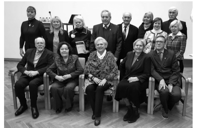
LZS Valdes locekļi un viesi

Informācija: Rīgas Tehniskā universitāte