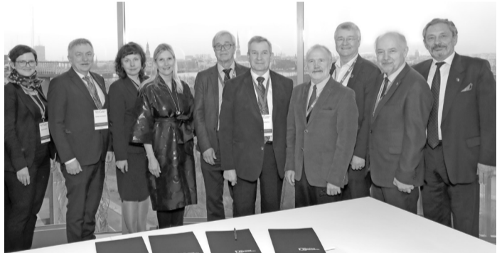
Zinātņu akadēmiju un augstskolu pārstāvji pēc Rīgas deklarācijas parakstīšanas