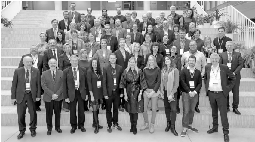
Konferences "Inovācijas – 21. gadsimta dzinējspēks" dalībnieku kopbilde

Otrdien, 25. februārī, Baltijas jūras valstu zinātņu akadēmiju sadarbības konferencē "Inovācijas – 21. gadsimta dzinējspēks" notika vēsturiska sadarbības dokumenta, visu reģiona valstu zinātņu akadēmiju vadītāju sagatavotās sadarbības deklarācijas – Rīgas deklarācijas – parakstīšana. Deklarācija paredz visu reģiona zinātņu akadēmiju un vadošo augstskolu sadarbību zinātnes projektu realizēšanā, kā arī vienota Baltijas jūras reģiona zinātnes inovāciju platformas izveidi.